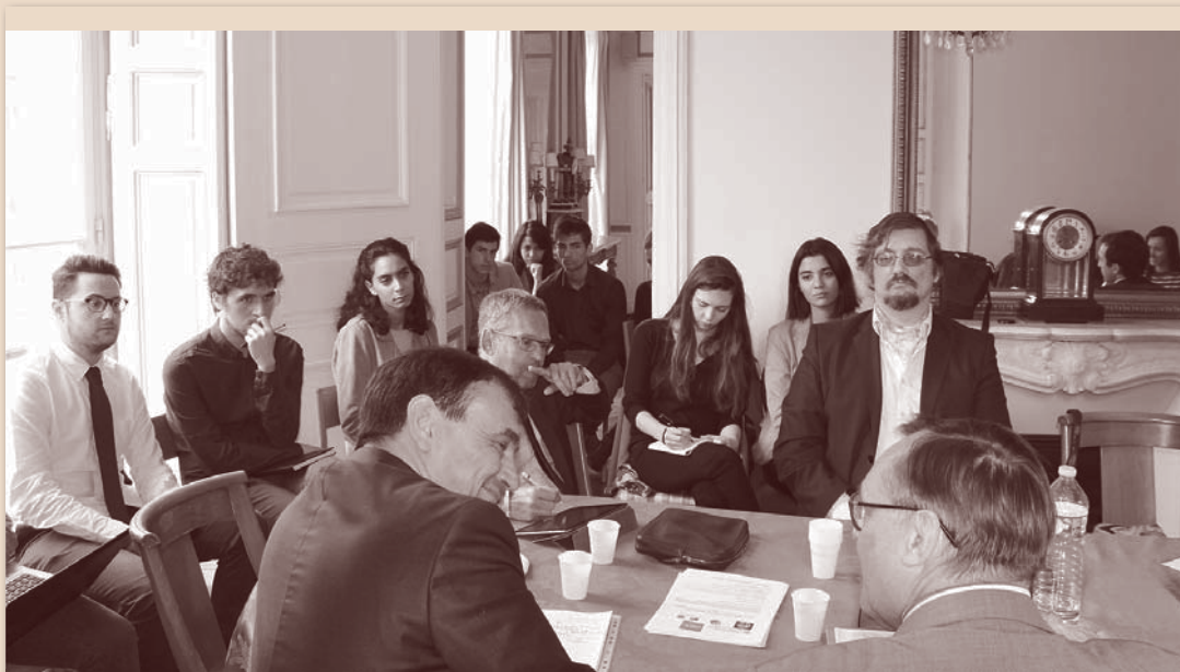
Российско-французский круглый стол «Статус судьи в государстве» (Университет Париж I Пантеон-Сорбонна, апрель 2017 г.)

Профессора и доценты кафедры входят в состав научно-консультативных и экспертных советов при Верховном Суде РФ, Генеральной прокуратуре РФ, Следственном комитете РФ, Комитете Государственной Думы РФ по безопасности и противодействию коррупции, Московском областном суде, в редакционные коллегии ведущих научных журналов, таких как «Государство и право», «Законность», «Законодательство», «Закон», «Уголовное судопроизводство», «Мировой судья». Члены кафедры неоднократно привлекались в качестве экспертов для дачи заключений по конкретным делам, рассматриваемым в том числе зарубежными судами.