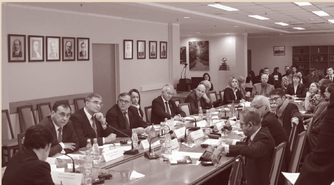
Российско-французский круглый стол «Роль суда в государстве» (юридический факультет МГУ, декабрь 2016 г.)

Профессора и доценты кафедры входят в состав научно-консультативных и экспертных советов при Верховном Суде РФ, Генеральной прокуратуре РФ, Следственном комитете РФ, Комитете Государственной Думы РФ по безопасности и противодействию коррупции, Московском областном суде, в редакционные коллегии ведущих научных журналов, таких как «Государство и право», «Законность», «Законодательство», «Закон», «Уголовное судопроизводство», «Мировой судья». Члены кафедры неоднократно привлекались в качестве экспертов для дачи заключений по конкретным делам, рассматриваемым в том числе зарубежными судами.