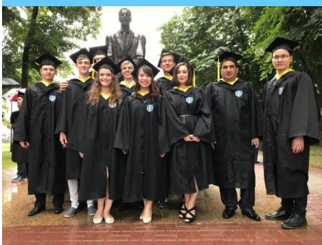
Выпускники программы, 2017

Партнёрами в проекте выступают университеты Хорватии, Франции и Словении.