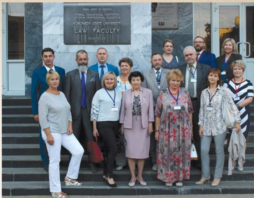
Участники III Всероссийской научно-практической конференции «Нравственные основы юридической деятельности (Кокоревские чтения)» Воронеж, 13 сентября 2019 г.