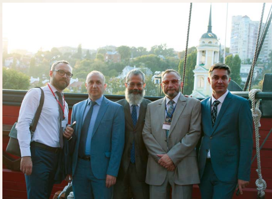
Экскурсия на первый российский линейный корабль регулярного военно-морского флота XVII в. «Гото Предестинация» («Божье Предвидение»)