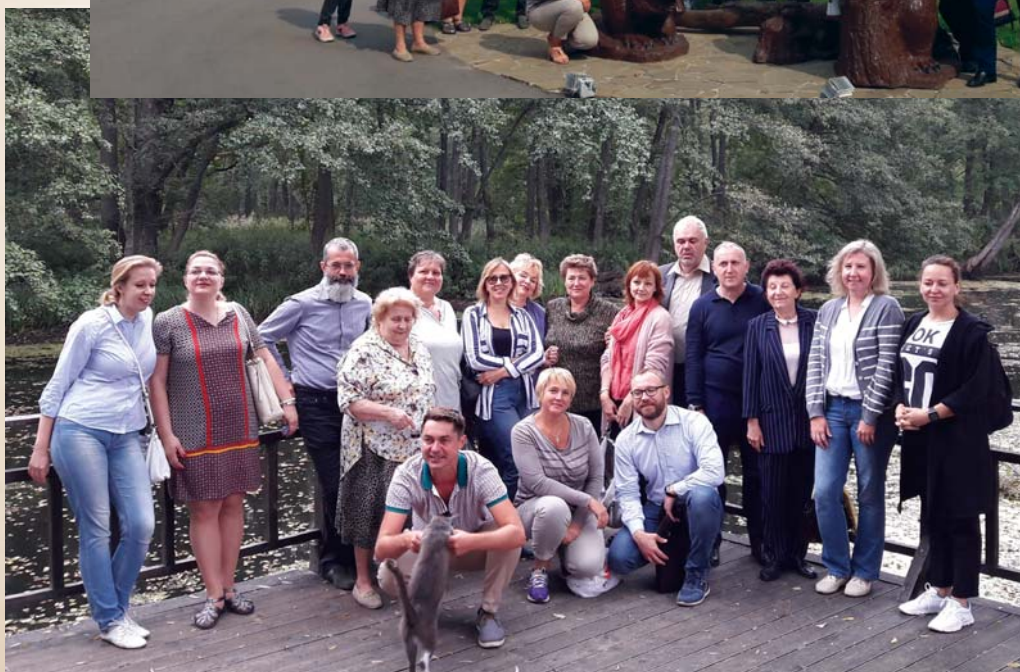
Экскурсия в Воронежский государственный природный биосферный заповедник имени В. М. Пескова