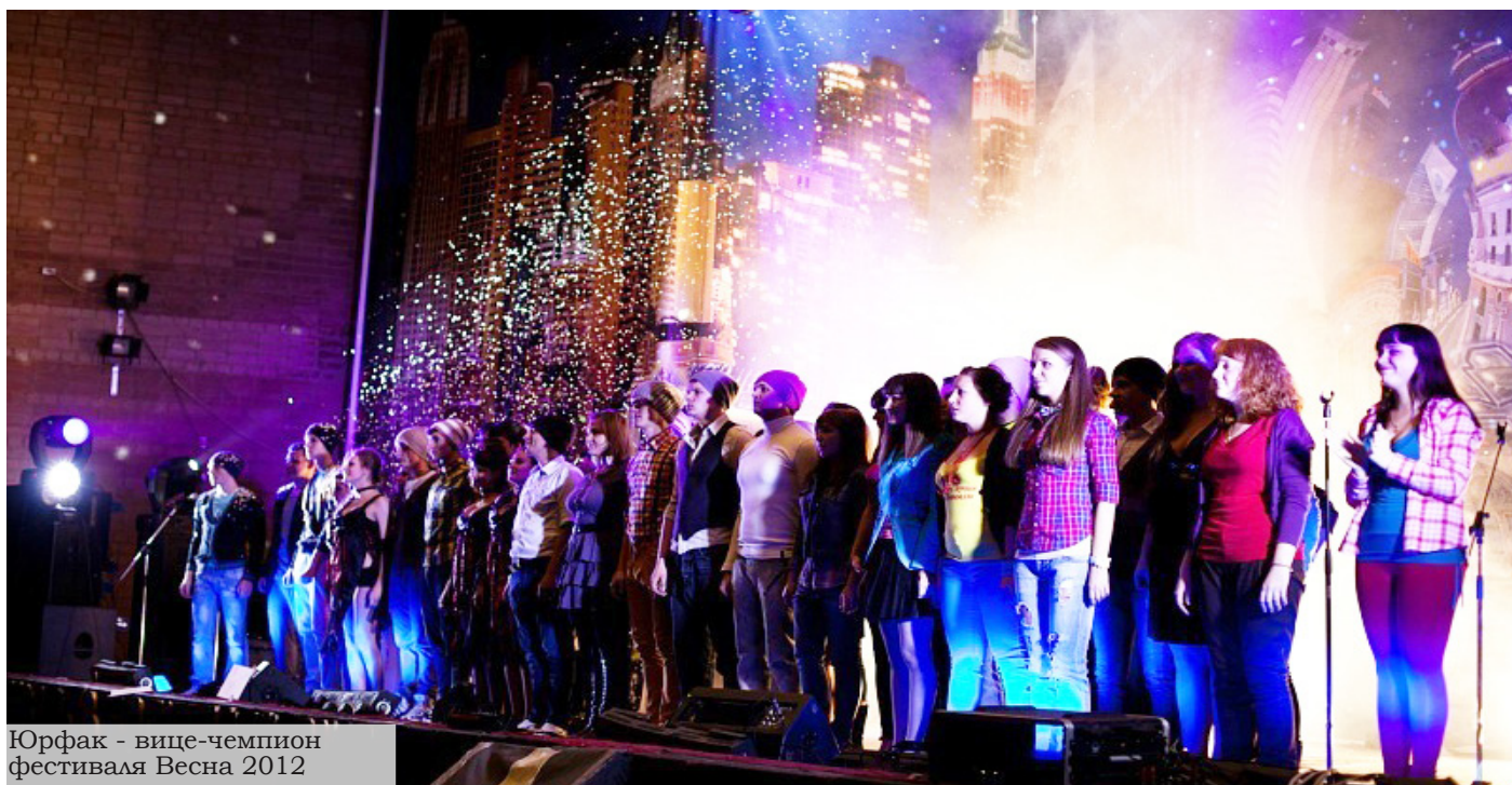
Юрфак - вице-чемпион фестиваля Весна 2012

ПРОФСОЮЗ И СТУДЕНЧЕСКИЙ СОВЕТ ПРЕДСТАВЛЯЮТ