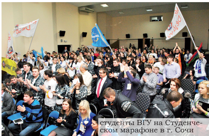
студенты ВГУ на Студенческом марафоне в г. Сочи