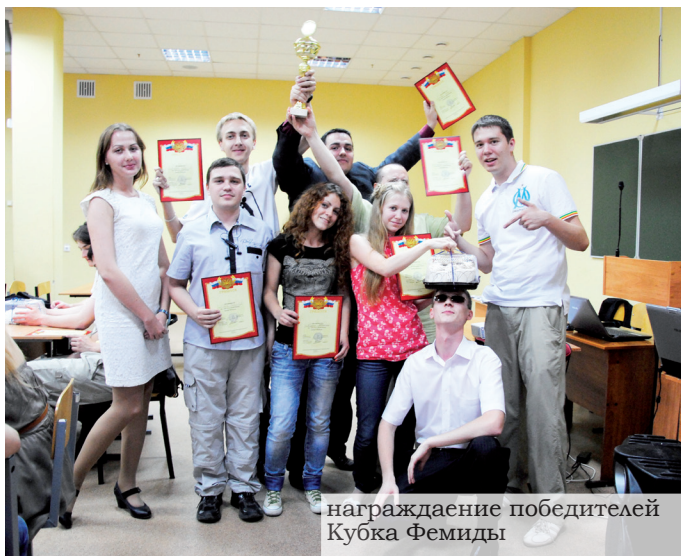
награждение победителей Кубка Фемиды