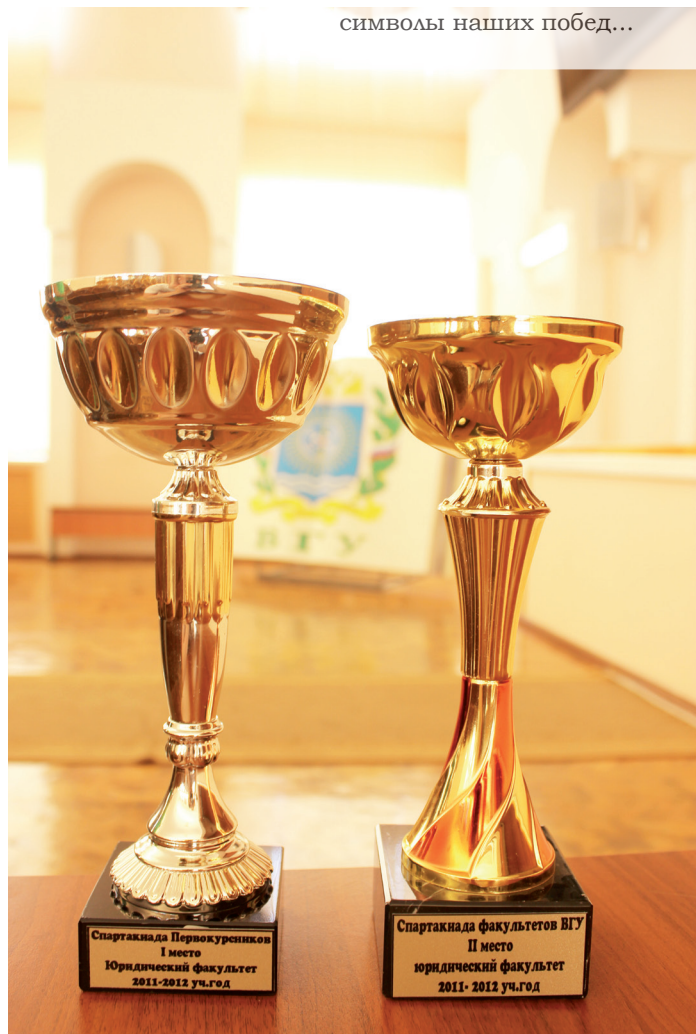
символы наших побед...