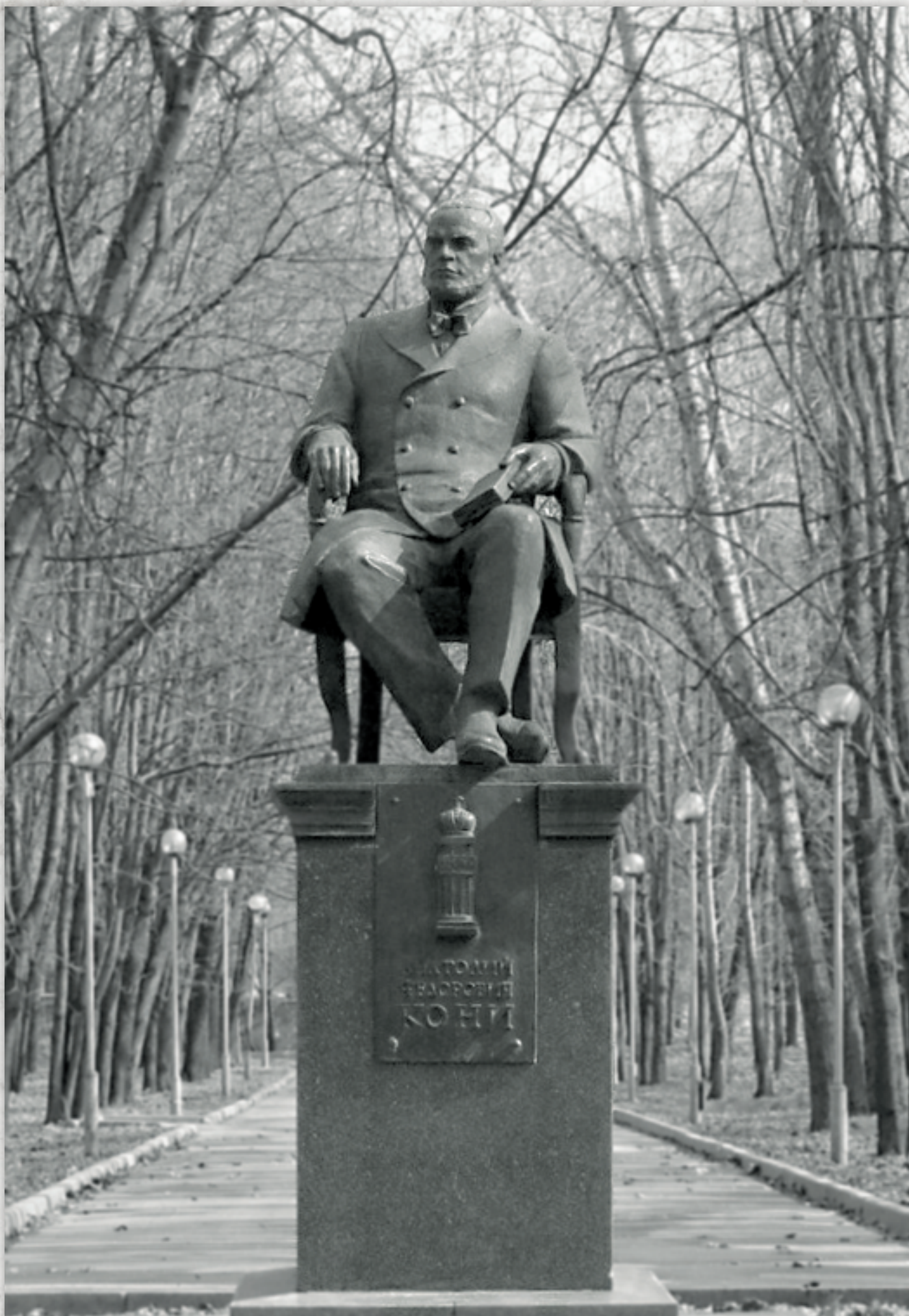
Семьинин А.П. Памятник А.Ф. Кони. Москва