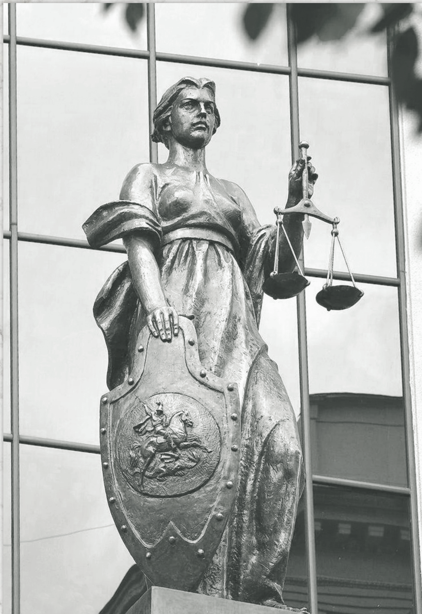
Коллектив реставраторов здания Верховного Суда. Фемида. Москва