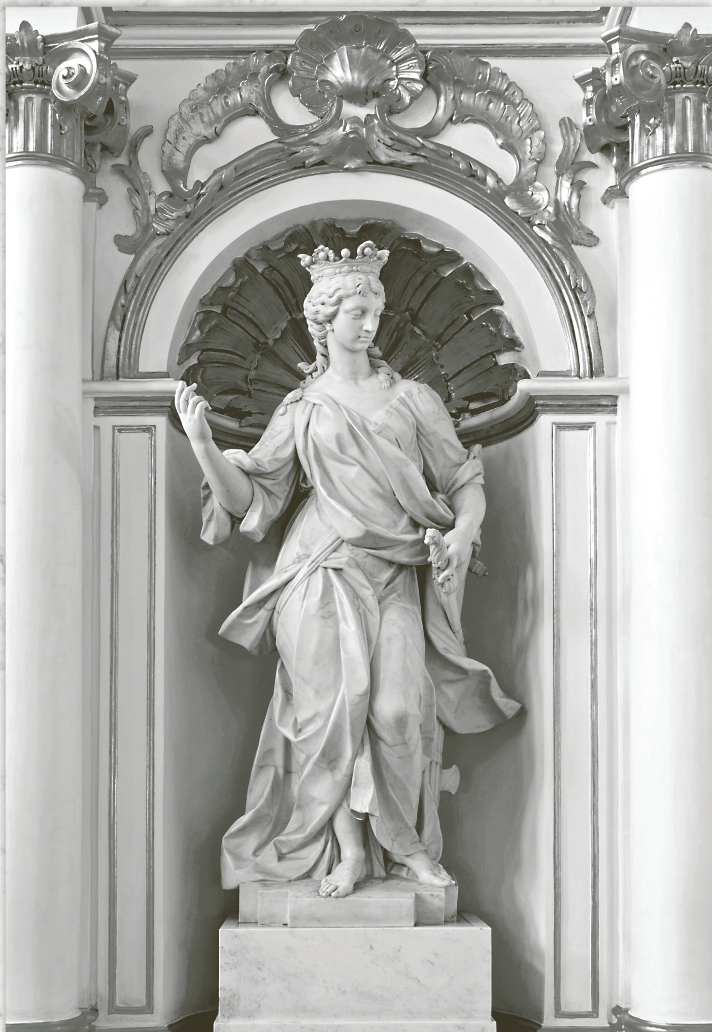
Альвизе Тальяпьетра. Правосудие. Эрмитаж. Санкт-Петербург

«А эти судейские – народ живучий». Александр Дюма (отец)