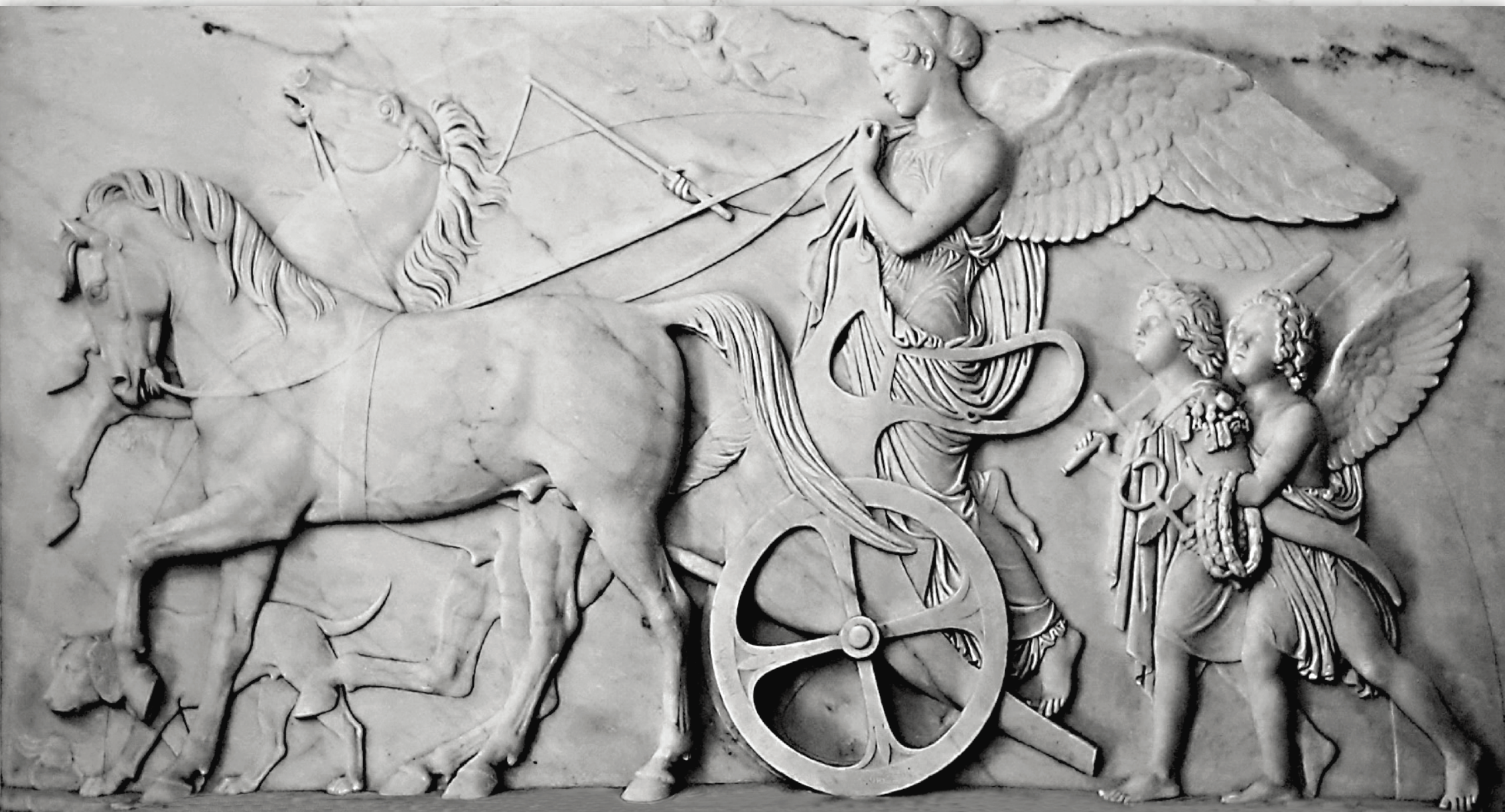
Бертель Торвальдсен. Немезида. Музей Торвальдсена в Копенгагене

Греческая богиня возмездия и справедливого наказания мчится на колеснице по зодиакальному кругу. От нее не может укрыться ни одно преступление, ее взгляд пронизывает всю Вселенную. В зависимости от поступков людей она одаряет их благами или несчастьями. Немезида изображена с атрибутами надзора за порядком (весы, уздечка), неотвратимого наказания (меч или плеть), быстроты воздаяния (крылья или колесница) и соразмерности кары (согнутая рука в локте). Позади богини два гения (ангелы-хранители): Наказания с мечом и Поощрения с рогом изобилия.