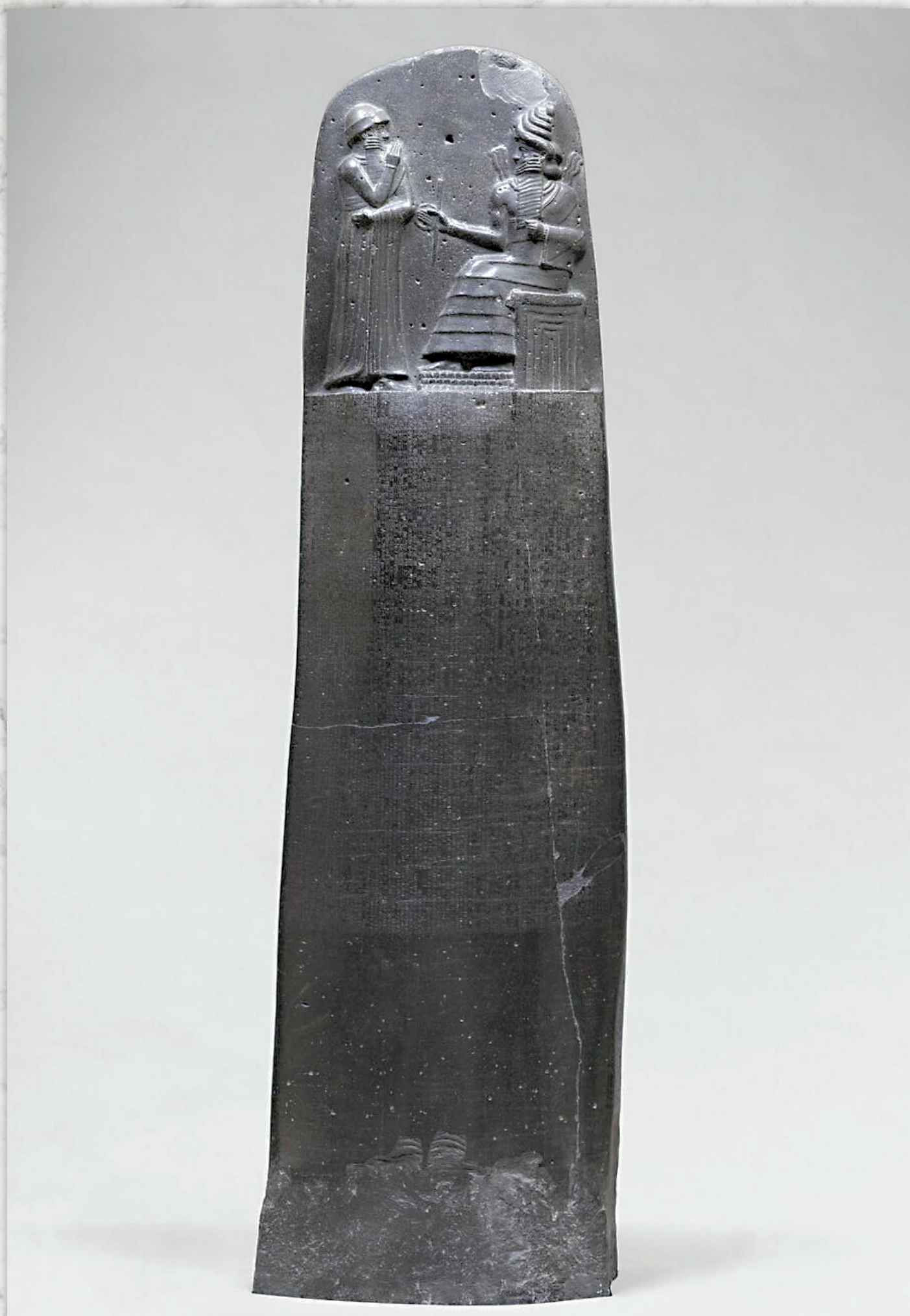
Стела Законов Хаммурапи. Лувр. Париж