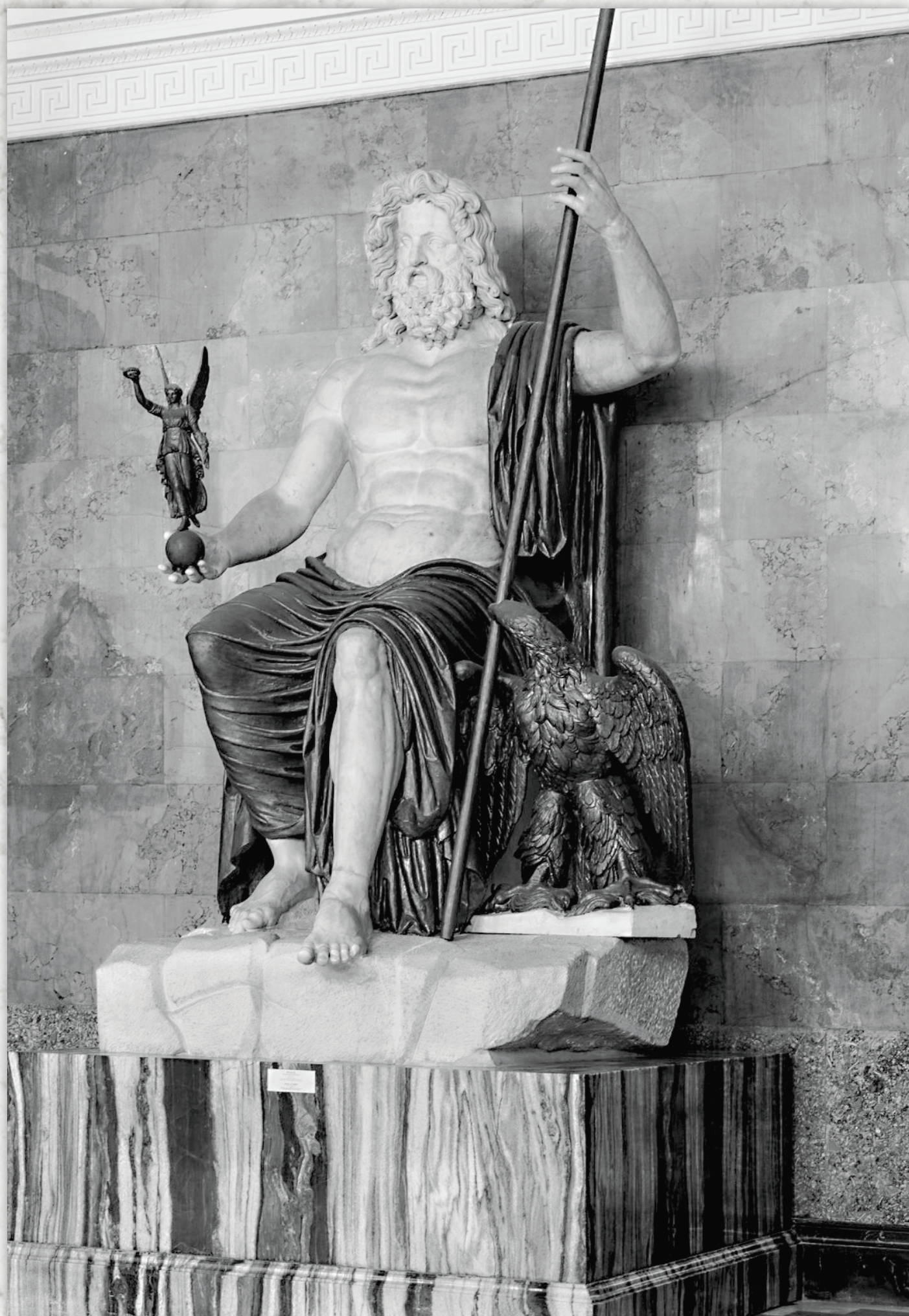
Римский скульптор. Юпитер. Эрмитаж. Санкт-Петербург