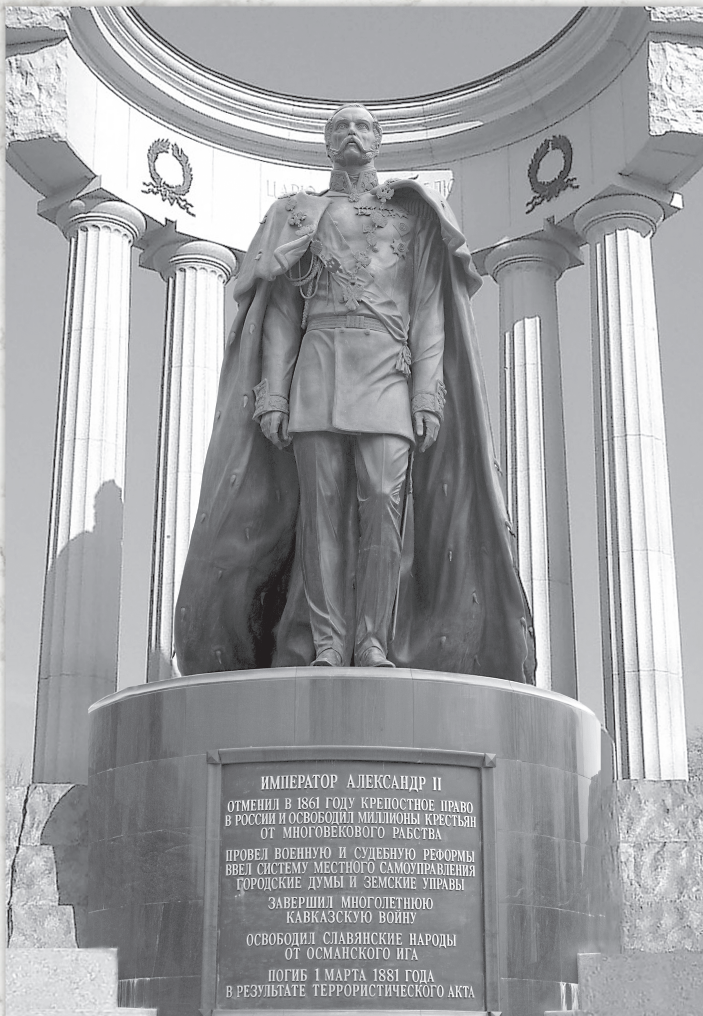
Рукавишников А. И. Памятник Александру II Освободителю. Москва