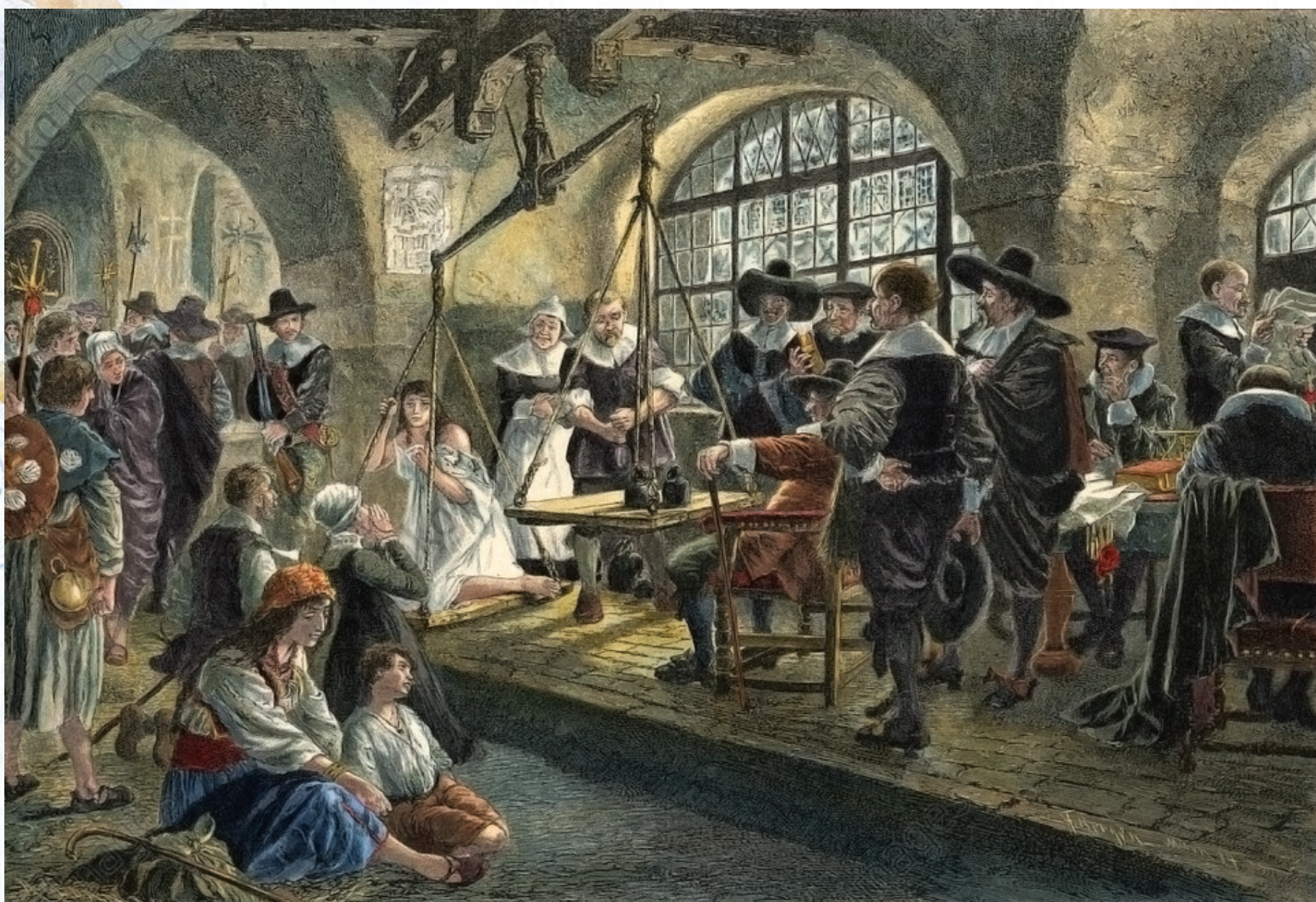
Фриц Берген. «Ведьмины весы в Аудватере» (1884)

Инквизиционный процесс утверждал, что любая реакция обвиняемых в ходе их допросов или пыток однозначно толковалась в пользу виновности: «Если обвиняемая вела дурной образ жизни, то это являлось несомненным доказательством ее связи с дьяволом; если же она была благочестива и вела себя примерно, то судьям было ясно, что она притворялась, дабы своим благочестием отвлечь от себя подозрения в связи с дьяволом и в ночных путешествиях на шабаш. Если на допросе она обнаруживает страх, то ясно, что виновна: совесть ее выдает. Если же она, уверенная в своей невинности, держит себя спокойно, то нет сомнений, что она виновна, ибо, по мнению судей, ведьмам свойственно лгать с наглым спокойствием...» (Фридрих Шпее).