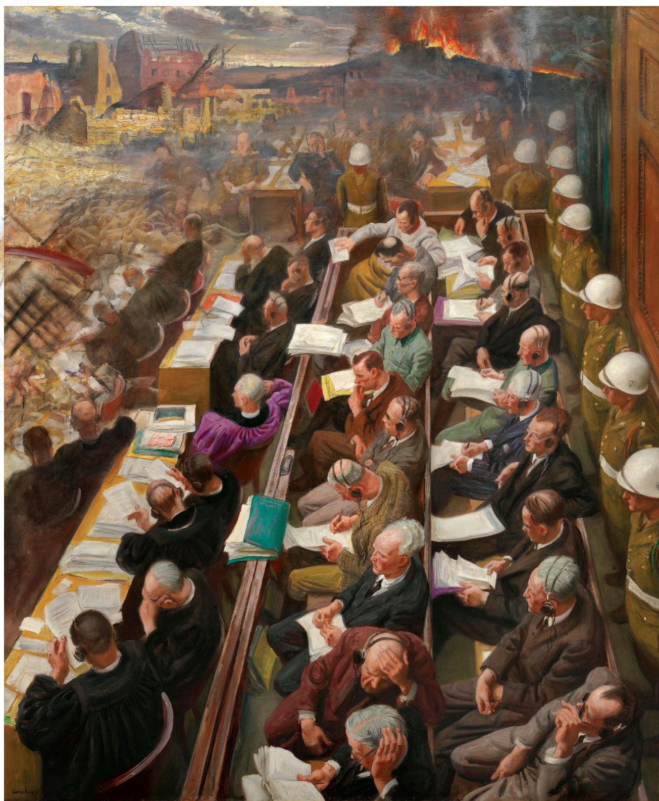
Лаура Найт. «Нюрнбергский процесс» (1946)

Лаура Найт была назначена военным корреспондентом на Нюрнбергский процесс в январе 1946 г. и в течение трех месяцев освещала ход процесса в специальной передаче для BBC. Ее репортерское место располагалось прямо над подсудимыми, что позволило делать карандашные наброски основных участников трибунала. Полотно точно воспроизводит сцену в зале суда и по сути является групповым портретом обвиняемых и представлявших их защитников.