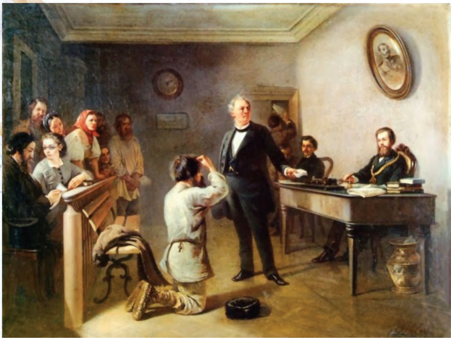
А. М. Волков. «В суде» (1867)

Адриан Маркович Волков – мастер бытового жанра; в его творчестве наглядно прослеживается реальная общественная и частная жизнь человека, со всей ее полнотой чувств и эмоций. Тяга к жанровому искусству возникает у А. М. Волкова еще в годы обучения в Академии художеств, когда преподаватели отмечали «наклонность к комизму и умение схватывать простонародные типы». Художнику чужды постановочные сцены – он как бы подглядывает за героями своих сюжетов, но при этом живописными решениями выражает личное отношение к происходящему.