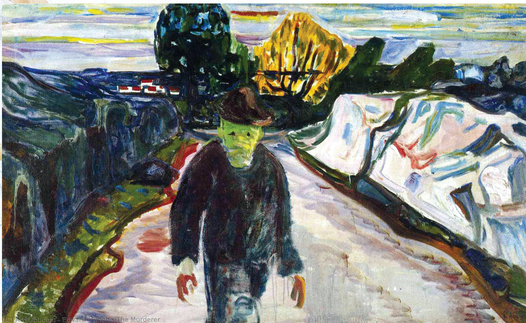
Эдвард Мунк. «Убийца» (1910)

Кисти норвежского экспрессиониста Эдварда Мунка (1863–1944) принадлежит ряд работ с общим сюжетом и единым названием – «Убийца». К этой теме Мунк обращается неоднократно вследствие прочитанной газетной заметки о том, как обычного горожанина задушили на дороге.