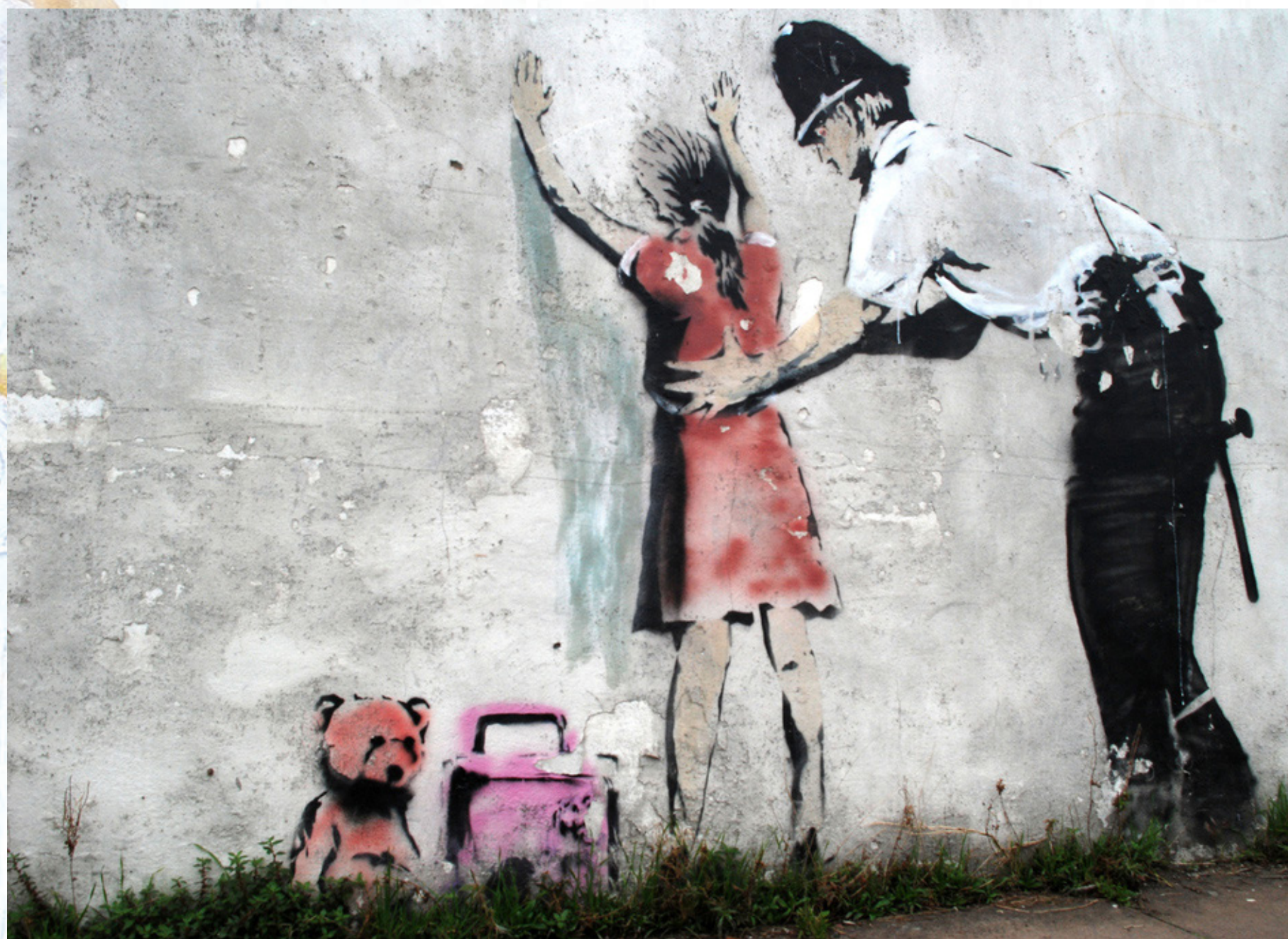
Бэнкси. «Полицейский, обыскивающий девочку»

Бэнкси – самый узнаваемый художник в мире граффити, да и, пожалуй, современного искусства, о жизни которого практически ничего неизвестно. Он анонимен. Да и что может изменить имя автора, если его работы уже успели стать бессмертными? Бэнкси – первый представитель уличного граффити, чьи произведения продают в аукционных домах с мировым именем, коллекционируют знаменитости и выставляют в ведущих музеях мира.