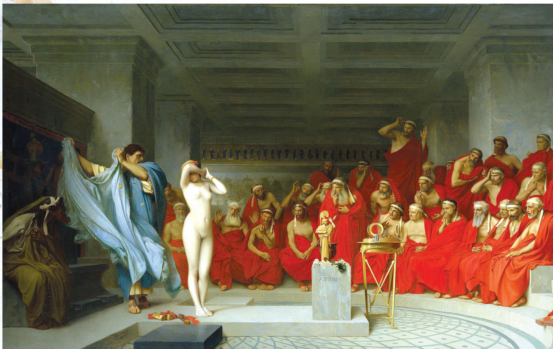
Жан-Леон Жером. «Фрина перед ареопагом» (1861)

Предание гласит: знаменитая афинская гетера Фрина была одной из самых известных женщин Античности. Красота ее была столь совершенной, что одно только это позволило бы ей навечно остаться в истории. Гениальный скульптор Пракситель, боготворивший гетеру и дерзнувший впервые изваять фигуру Афродиты полностью обнаженной, сделал Фрину своей моделью. Слава о доселе невиданной скульптуре Афродиты, прозванной Книдской (по месту нахождения ее святилища), разлетелась по всей Элладе. Тысячи паломников молились и восхищались божественной красотой самой знаменитой статуи богини любви.